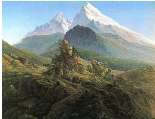
Caspar David Friedrich (1774-1840) Το όρος Watzmann στις Άλπεις, 1824

3 η Συνάντηση Φιλοσόφων Κοινωνικών Επιστημόνων και Συνοδοιπόρων